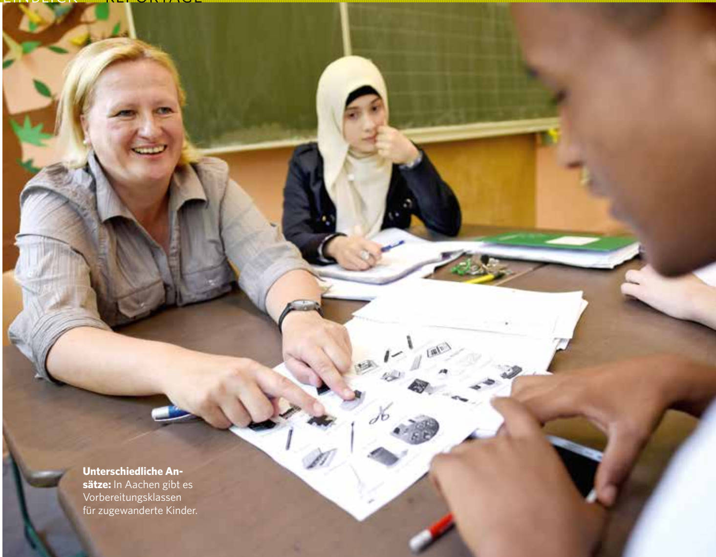
Unterschiedliche Ansätze: In Aachen gibt es Vorbereitungsklassen für zugewanderte Kinder.