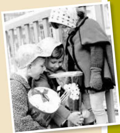
Seit 1966 werden alle Schüler in Deutschland im Spätsommer eingeschult.