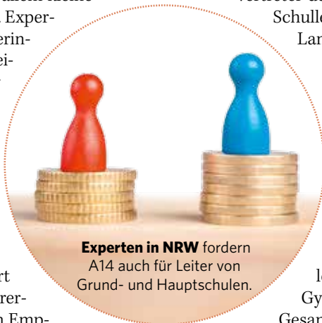
Experten in NRW fordern A14 auch für Leiter von Grund- und Hauptschulen.

Eine der wichtigsten Empfehlungen lautet, Schulleitungen von Grund- und Hauptschulen unabhängig von der Größe der Schule mit A14, Stellvertreter mit A13 zu besolden. Zurzeit werden Schulleitungen dieser Schulformen deutlich geringer entlohnt als Schulleiterinnen und Schulleiter an Gymnasien, Berufskollegs und Gesamtschulen. Die Gesamtkosten lägen laut Experten bei rund 18.000.000 Euro jährlich. Darüber hinaus raten sie, die Mindestleistungszeit an jeder Schule auf 16 Stunden festzulegen.