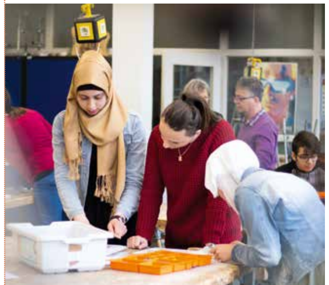
Mehrere hundert ausländische Schüler lernen an der Paulus-Canisius-Schule in Recklinghausen die deutsche Sprache.