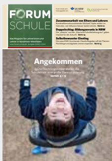
Forum Schule 1/2016