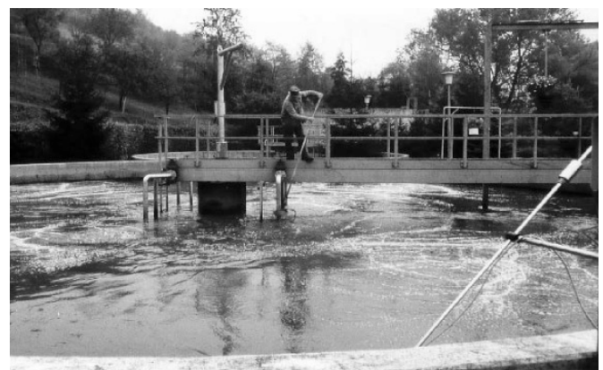
Bild 3. Reinigungsarbeiten am Belebtschlammbecken.

Auf Kläranlagen werden überwiegend Wartungs-, Reinigungs- und Reparaturarbeiten verrichtet (Bild 5). Die inhala-