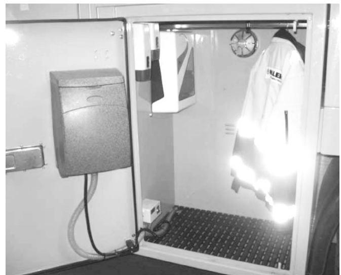
Bild 5. Hygienekammer am Kanalspülfahrzeug.

Untersuchungen bei der Kanalspülung unter Verwendung eines Luftschleiers, der mithilfe eines Kompressors und eines fächerförmigen Auslasses über den Kanalschacht gelegt wird, haben gezeigt, dass sich hierdurch die Bioaerosole am Schacht deutlich reduzieren lassen (Bild 4) [7; 10]. Entsprechend ausgestattete Spülfahrzeuge sind inzwischen Stand der Technik. Auch wird die Nutzung der Fernbedienung verbindlich gemacht. Die Mitarbeiter sind in diesem Zusammenhang anzuweisen, den Spülwagen mit der Fernbedienung in deutlichem Abstand vom Schacht zu steuern.