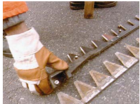
Schutzhandschuhe beim Handhaben von Mähmessern

Verboten ist dagegen der Gebrauch von Schutzhandschuhen bei Arbeiten an Kreissäge oder Ständerbohrmaschine. Hier ist die Gefahr, beim Hängenbleiben mit dem Handschuh von der Maschine erfasst und eingezogen zu werden höher anzusetzen, als die Gefahr sich am Werkstück zu verletzen.