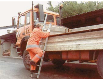
Aluminium-Leiter mit rutschhemmenden Stollen und Holmverlängerung

Wenn das Fahrzeug von Hand be- oder entladen werden muss, fallen verschiedene Arbeiten direkt auf der Ladefläche der Fahrzeuge an. So ist z.B. das Ladegut zu verzurren oder es sind Maschinen und Geräte platzsparend zu verstauen. Hierfür sollten im Bereich der Bordwände geeignete Aufstiegshilfen fest angebracht sein, denn nicht immer ist eine Leiter zur Stelle. So rutschen z.B. die Beschäftigten häufig ab, wenn sie über die Hinterräder aufklettern oder direkt