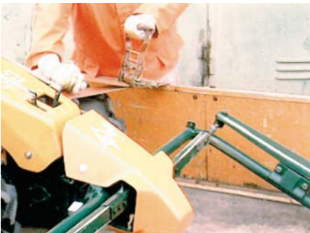
Verzurren einer fahrbaren Maschine mittels Zurrgurt und Spannvorrichtung.

Für den sicheren Transport müssen Lasten auf der Ladefläche sicher befestigt werden. Vor allem fahrbare Maschinen müssen während der Fahrt und insbesondere bei Bremsungen so gesichert sein, dass sie sich nicht selbstständig bewegen können. Hierfür sind viele neuere Transportfahrzeuge bereits mit entsprechenden Ösen ausgerüstet, um ein sicheres Verzurren zu ermöglichen. Fehlen solche Einrichtungen, stellen Zurrgurte mit Spannvorrichtung, die um die gesamte Ladefläche einschließlich Ladung gespannt werden, eine gute Hilfe dar.