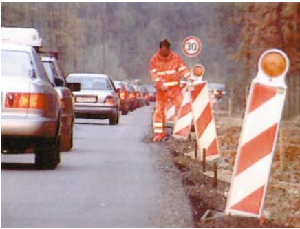
Warnkleidung in Tagesleuchtfarbe und mit retroreflektierenden Streifen.

ten Schutzhandschuhe aus grobem Gewebe mit Innenflächen aus Leder völlig ungeeignet, wenn z.B. mit Lösemitteln (Kraftstoff, Kaltreiniger, Verdüner, Tri) gearbeitet werden muss. Gleiches gilt für Schweißarbeiten aus Gründen der Brennbarkeit und Isolierung gegen Hitze. Dafür gibt es spezielle Handschuhe, die vollständig aus Leder und mit langen Stulpen gefertigt sind.