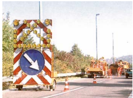
Sicherung einer Arbeitsstelle auf einer Bundesautobahn

Je nach Dauer der Verkehrsbehinderung ist naturgemäß der Aufwand für die Absicherung unterschiedlich. Für Baustellen liefert die RSA detaillierte Aussagen, die auf die verschiedenen Anforderungen auf Bundesautobahnen, sowie auf Straßen außerhalb und innerhalb von Ortschaften eingehen. Arbeitsstellen, die am Ende des Arbeitstages wieder abgebaut werden, sind im Allgemeinen auch in ihrer Länge begrenzt und dadurch überschaubar.