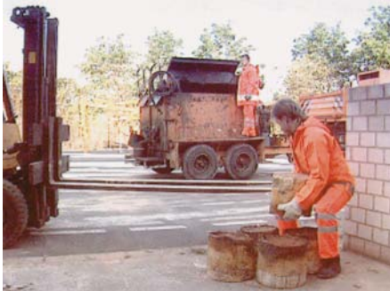
Richtiges Heben schwerer Lasten aus den Knien heraus mit geradem Rücken

schwerer Granitbordsteine verstärkt dabei die einseitige Belastung der Wirbelsäule erheblich. Des Weiteren sind die Gebinde für Baustoffe, Bitumen, Salz etc. des öfteren noch nicht auf kleinere Größen umgestellt.