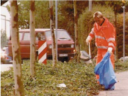
Einsammeln von Abfällen vor Grünpflegearbeiten

immer wieder Getränkedosen von Mähwerkzeugen erfasst und mit großer Wucht weggeschleudert. Kunststoffseile oder Stoffteile können sich um die Werkzeuge wickeln und dort durch Erwärmung so verkleben, dass ein Entfernen nahezu unmöglich wird.