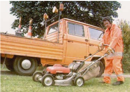
Gehörschutz beim Umgang mit lauten Maschinen

Besondere Bedeutung kommt dem Gehörschutz dann zu, wenn ihn Fahrzeugführer (z.B. von selbstfahrenden Arbeitsmaschinen) während der „Teilnahme am Straßenverkehr“ tragen müssen: Hierbei ist es notwendig, dass die Signaldurchlässigkeit des Gehörschutzes gewährleistet sein muss. Vom BIA (=Berufsgenossenschaftliches Institut für Arbeitsschutz und Arbeitsmedizin, St. Augustin) eigens daraufhin geprüfte Gehörschützer erfüllen diese Anforderungen.