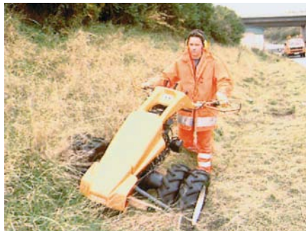
Arbeiten mit dem Balkenmäher auf Böschungen

Für diesen Einsatz fordern die einschlägigen Vorschriften besondere technische Ein-