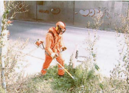
Volle Schutzausrüstung beim Umgang mit der Motorsense

Üblicherweise sind die Beschäftigten im Unterhaltungsdienst mit folgenden persönlichen Schutzausrüstungen ausgestattet: