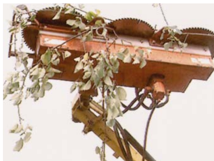
Spezialgerät zum Lichtraumprofil schneiden