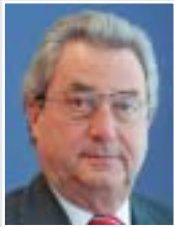
Dr. Dieter Hundt, Präsident der Bundesvereinigung Deutscher Arbeitgeberverbände