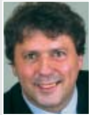
Uwe Schummer, CDU-Bundestagsabgeordneter aus Viersen