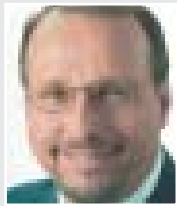
Roland Schäfer, Präsident des Städte- und Gemeindebundes NRW