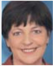
Ulla Schmidt, Bundesministerin für Gesundheit und Soziale Sicherung