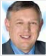
Karl-Josef Laumann, Minister für Arbeit, Gesundheit und Soziales des Landes NRW