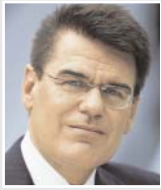
Joachim Erwin, Oberbürgermeister der Stadt Düsseldorf und Stellvertreter des Präsidenten des Deutschen Städtetages