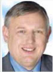
Karl-Josef Laumann, Minister für Arbeit, Gesundheit und Soziales des Landes NRW