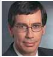
Günter Winands, Staatssekretär im Ministerium für Schule und Weiterbildung des Landes Nordrhein-Westfalen