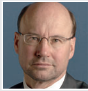
Franz-Josef Lersch-Mense, Staatssekretär im Bundesministerium für Arbeit und Soziales (BMAS)