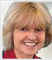
Barbara Sommer, Ministerin für Schule und Weiterbildung des Landes Nordrhein- Westfalen