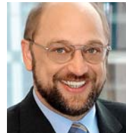
Martin Schulz, SPE-Fraktionsvorsitzender im Europäischen Parlament

■ Gute Arbeit setzt einen starken Arbeits- und Gesundheitsschutz voraus. Beides ist nicht nur wichtig, um arbeitsbedingte Verletzungen oder Erkrankungen zu vermeiden, sondern auch ein Grundpfeiler für wirtschaftlichen Erfolg jedes Betriebs. Wir wollen verstärkt auf Prävention