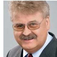
Elmar Brok, Mitglied des Europäischen Parlaments für die CDU

Die Infos europäischer Agenturen zur Unfallverhütung, zu Gefahrenstoffen und zu Krankheitsbildern retten Leben. Daher setze ich mich hier schon lange für bindende Rechtsvorschriften ein. Arbeitsschutz ist dank Europa gelebte ökonomische und humanitäre Vernunft.