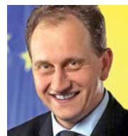
Alexander Graf Lambsdorff, Mitglied des EU-Parlaments für die FDP

■ Europäische Mindeststandards können bei grenzüberschreitenden Sachverhalten sinnvoll sein, ich rate aber ab, den Arbeits- und Gesundheitsschutz europaweit zu vereinheitlichen. Gerade als überzeugter Europäer bin ich dafür, Probleme möglichst nah am