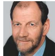
Michael Cramer, Mitglied des Europäischen Parlaments für Die Grünen

zeit angerechnet wird. Damit sollen Arbeitnehmer nicht nur vor den Risiken der Übermüdung geschützt werden, auch das Unfallrisiko kann somit gesenkt und ausreichend Erholung für die körperliche und seelische Gesundheit jedes Einzelnen gewährleistet werden.