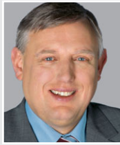
Karl-Josef Laumann, Minister für Arbeit, Gesundheit und Soziales des Landes NRW.