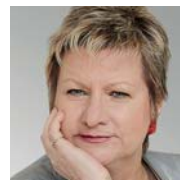
Sylvia Löhrmann, Fraktionschefin Bündnis 90/Die Grünen im Landtag

■ Wir wollen den Arbeits- und Gesundheitsschutz ausbauen. Besonders wichtig ist für uns der konsequente Nichtraucherschutz. Schutz vor Passivrauchen muss am Arbeitsplatz, in öffentlichen Einrichtungen und in der Gastronomie für Angestellte und Gäste gelten. Des-