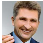
Andreas Pinkwart, Wissenschaftsminister des Landes NRW (FDP)

■ Gesunde und motivierte Beschäftigte sind Garant für die Wettbewerbsfähigkeit der Unternehmen in NRW. Der demografische Wandel und der sich abzeichnende Fachkräftemangel machen Arbeits- und Gesundheitsschutz noch wichtiger. Deshalb hat das Arbeitsministerium jetzt das Internet-Portal www.arbeitsschutz.nrw.de komplett überarbeitet. Das Online-Angebot bietet nicht nur viele nützliche und leicht verfügbare Informatio-