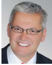
Hubert Hüppe, Beauftragter der Bundesregierung für die Belange behinderter Menschen