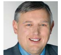
Karl-Josef Laumann, Sozialminister des Landes Nordrhein-Westfalen (CDU)

nen – der nächste persönliche Ansprechpartner ist auch stets nur einen Mausklick entfernt. Gerade kleinere und mittlere Organisationen profitieren beim Arbeitsschutz zudem sehr vom Online-Beratungsservice „KomNet“ des Landesinstitutes für Gesundheit und Arbeit.