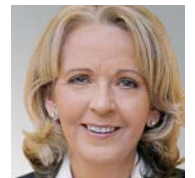
Hannelore Kraft, Vorsitzende der SPD-Landtagsfraktion

heitsgefährdende, aber auch -fördernde Verhaltensweisen geprägt. Dort, wo staatliche Stellen unmittelbar Verantwortung für Kinder und Jugendliche tragen, sind diese für ein gesundes Umfeld verantwortlich. Das gilt vor allem für Kindertagesstätten und Schulen.