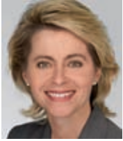
Dr. Ursula von der Leyen ist Bundesministerin für Arbeit und Soziales.