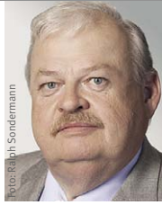
Guntram Schneider Minister für Arbeit, Integration und Soziales in Nord- rhein-Westfalen