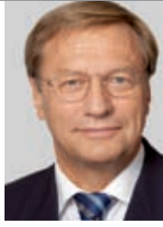
Harry K. Voigtsberger , Minister für Wirtschaft, Energie, Bauen, Wohnen und Verkehr des Landes Nordrhein-Westfalen