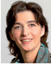
Barbara Steffens Ministerin für Gesundheit, Emanzipation, Pflege und Alter des Landes NRW