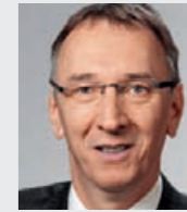
Bernd Pieper (55), Vorsitzender des Arbeitgeberverbandes des Landes NRW