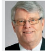
Herbert Dahle (63), Bürgermeister der Stadt Barntrup