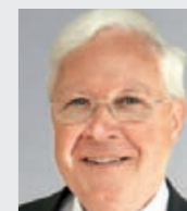
Franz Holtgrewe (61), Bürgermeister der Stadt Geseke