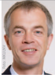
Johannes Rimmel, Minister für Klima- schutz, Umwelt, Landwirtschaft, Natur- und Verbrau- cherschutz des Landes NRW