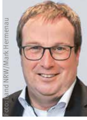
Oliver Krischer, Minister für Umwelt, Naturschutz und Verkehr des Landes Nordrhein-Westfalen